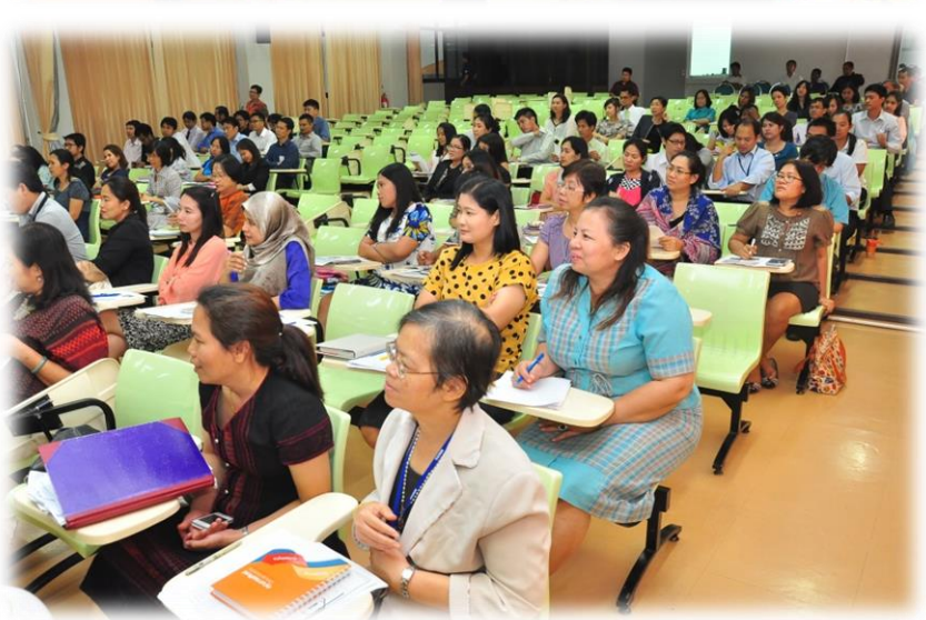
- บุคลากรในโรงเรียนร่วมฟังบรรยาย